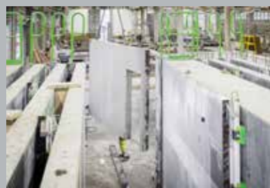
6. Подъем на склад