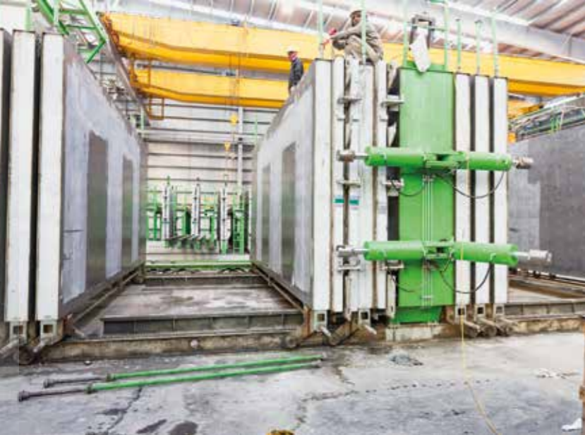
Формование желаемого размера с умными бортами