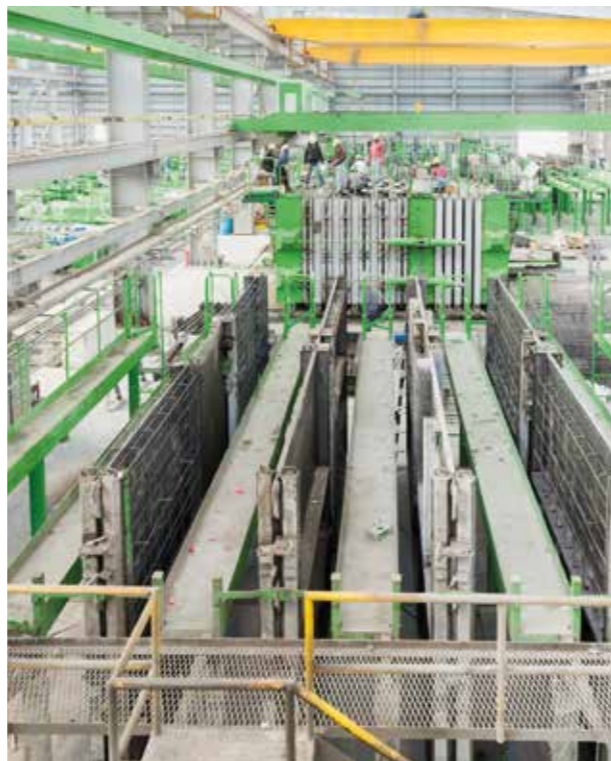
Система стальных листов в эксплуатации