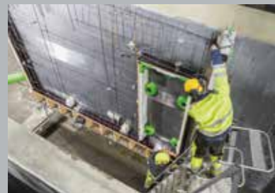
2. Арматура и вкладыши