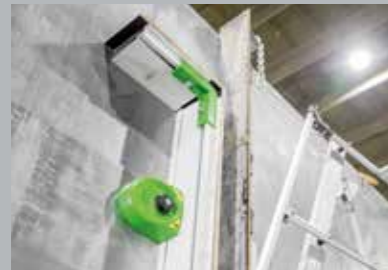
1. Оснастка при помощи FaMe