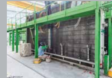
1. Оснастка, арматура и вкладыши