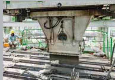
3. Формование и уплотнение