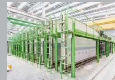
5. Окончательное затвердевание