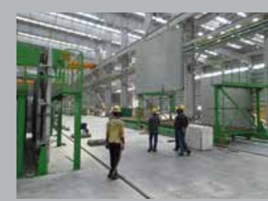
6. Подъем на склад