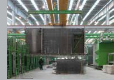
2. Подъем стального листа