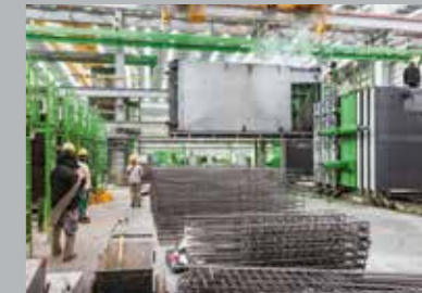
4. Подъем панелей